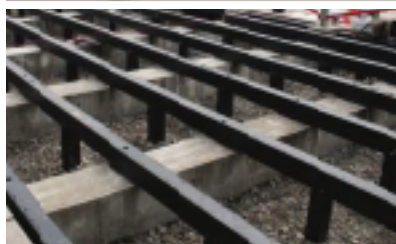
新潟県新潟市/信濃川河川敷 ボードウォーク