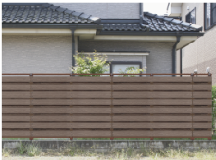
写真は軽量樹脂板D2-22K/ブラウン色

表面に凹凸のあるリアルな木目模様を付けることでさらに自然木の表情に近付けました。ご覧になった方からは「まさに木そのものだね」というおどろきの言葉と賞賛を多々いただいております。また、板厚についても従来の十ミリから十五ミリへと変更し、性能を大幅にアップさせました。これだけグレードをアップさせましたが、価格的には、ほぼ従来品と同じに据え置いています。